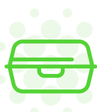
Extrusión de Lámina para Termoformado