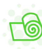
Extrusión Cast y Extrusión Soplado de Film